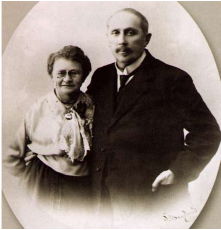
Nortamon pariskunta 1920-luvulla