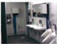
Luotus 12.7.2007 10:49 Siältötyyppi: Kuva Käyttö: 13