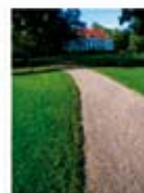
Luotus 22.9.2007 17:00 Siältötyyppi: Kuva Käyttö: 7