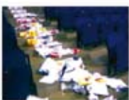
Luotus 16.2.2007 11:47 Siältötyyppi: Kuva Käyttö: 20