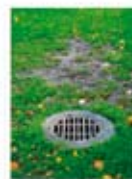
Luotus 22.9.2007 17:03 Siältötyyppi: Kuva Käyttö: 3