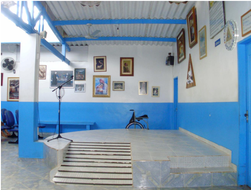
Casa d'Angélique 2009 www.casadangelique.com

Melko nopeasti suuressa kokoontumistilassa muodostetaan eri jonot, joiden kulkusuunnan olen nuolilla kuvannut piirtämäni kuvaan: