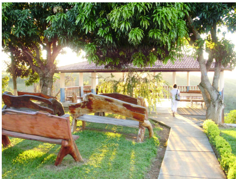
Casa d'Angélique 2009 www.casadangelique.com