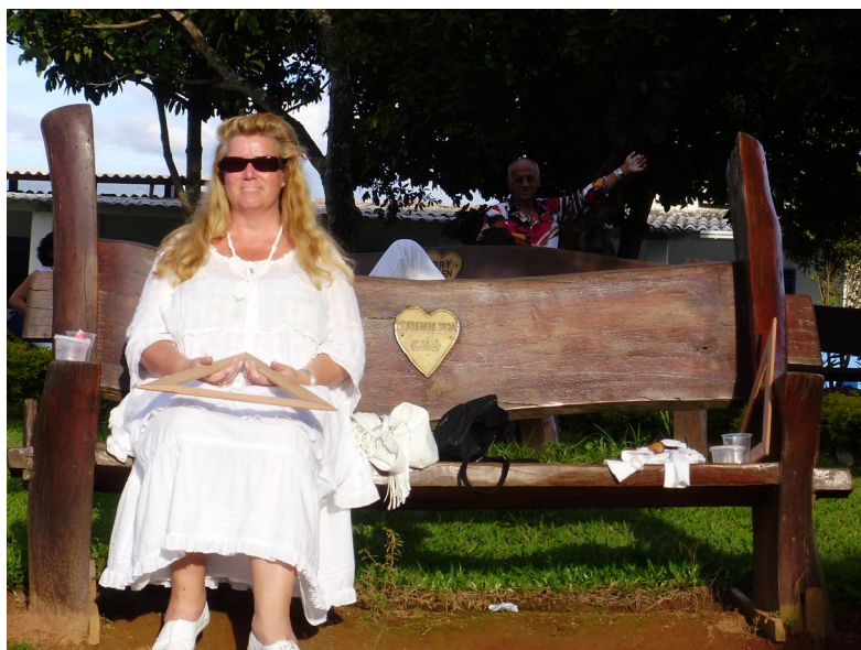
Casa d'Angélique 2009 www.casadangelique.com

Oma siunattu rukouskolmio kädessä, kuin koulutodistuksen saaneena kotiin lähdössä ☺