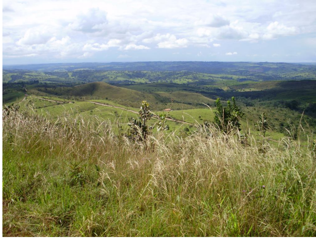
Casa d'Angélique 2009 www.casadangelique.com