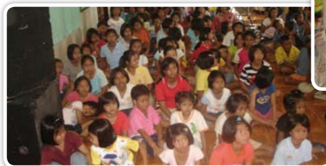
< Lapsille järjestetään myös tilaisuuksia.