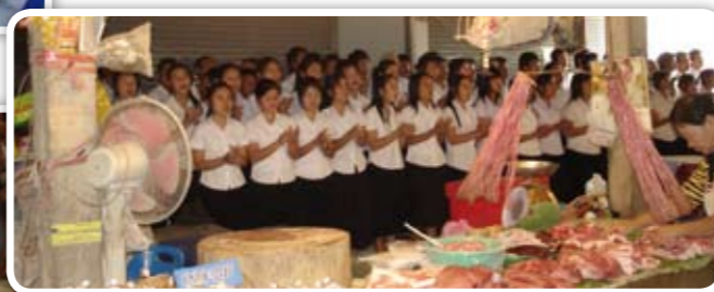
Oppilaskuoro laulaa paikallisella lihatorilla.