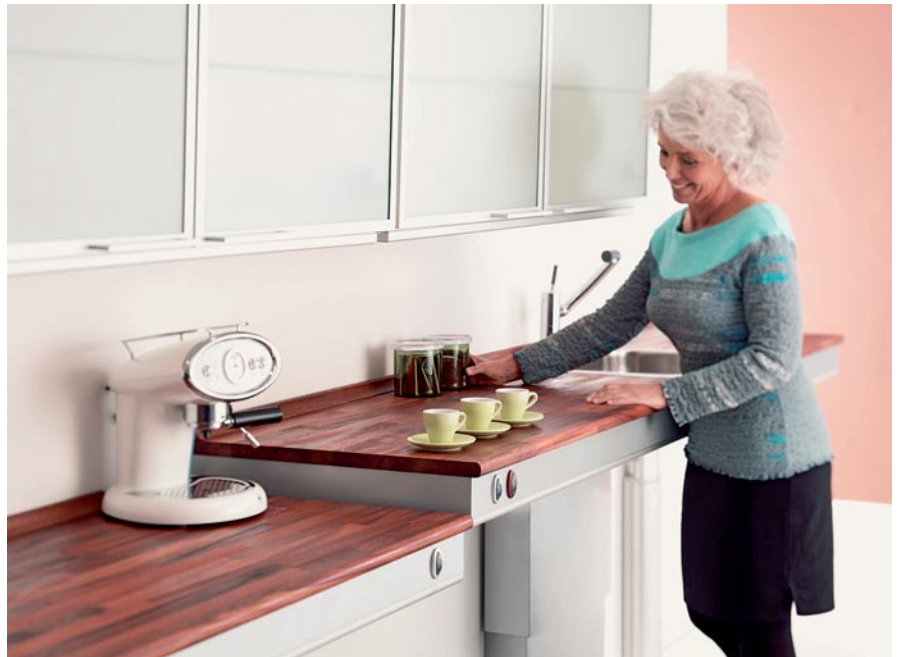
Pöytätasojen korkeusasemaa voidaan muuttaa portaattomasti 300 mm.

Nostomekanismi valmistetaan tehtaalla aina mittojen mukaan tapauskohtaisesti, jolloin keittiössä voidaan vapaasti käyttää myös erikoismittaisia kalusteita. Myös kulmamalliset keittiöratkaisut voidaan toteuttaa Pressalit Care -nostomekanismin avulla.