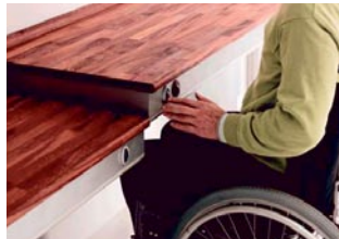
Pöytätason ja kaappien ohjauskytkimet on sijoitettu tason etureunaan.