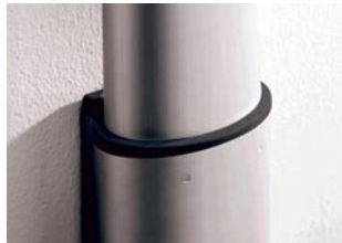
Jalan alumiininen suojakuori kiinnitetään seinään.