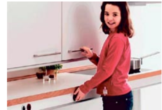
Kaapin korkeusasemaa ohjataan työtason etureunan kytkimellä.