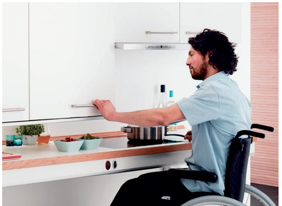
Yläkaappien korkeusasemaa voidaan samoin portaattomasti muuttaa korkeussuunnassa 350 mm ja syvyyssuunnassa 150 mm.