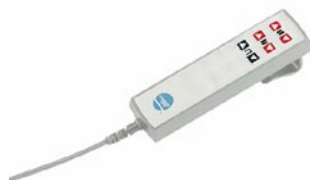
Ohjausyksikkönä voi olla myös käsisäädin.