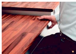
Turvalista pysäyttää tason liikkeen törmätessään esteeseen.