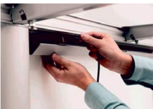
Johdot voidaan kuljettaa kätevästi johtokourussa.