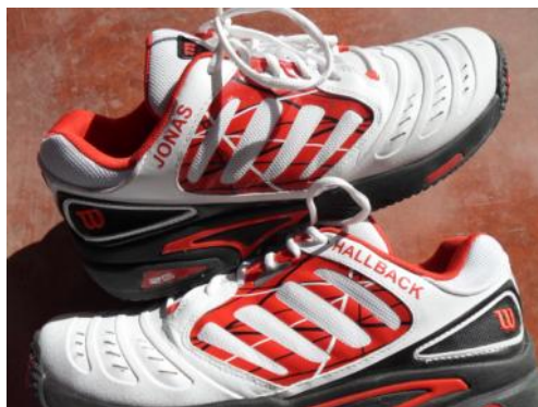
Uudet nimikoidut pelitossut turnausta varten...

Honas toivottaa kaikille GT:n pelureille onnea treeneihin ja kilpailuihin sekä oikein mukavaa hiihtolomaa!!!