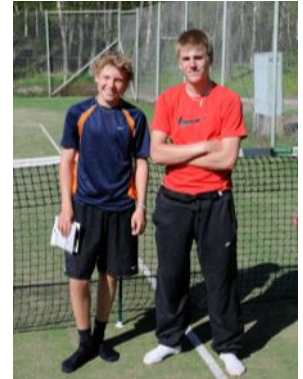
Vuoden 2009 A3 luokan finalistit