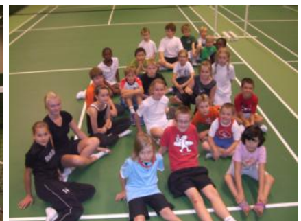
Grani Tenniksen toimintaan oltiin erittäin tyytyväisiä