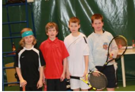
GT:n ja LoTe:n tyytyväisiä pelureita