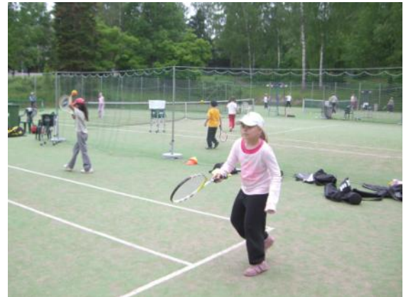
Kuva kesän 2009 kesäleiriltä