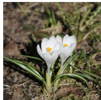
Kuvia Espoon keskuspuistosta 25.4.