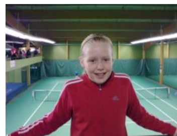
Teresa pelasi hyvät kisat

Filip von Troil —Anton Tauru Smash-Kotka 67,26