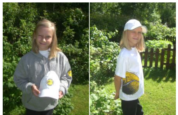
Tyylikäs GT- lippis 10 €

GT:n sporttisia collegeasuja, T-paitoja ja lippiksiä saatavilla hallin proshopista. Ne, jotka tilasivat ennakkoon, tuotteet ovat noudettavissa hallilta (miesten T-paita koko L jälkitoimituksessa). Jokaisesta koosta on muutama ylimääräinen, joten jos ei ehtinyt mukaan yhteistilaukseen, niin vielä mahdollisuus saada asuja kesäksi.