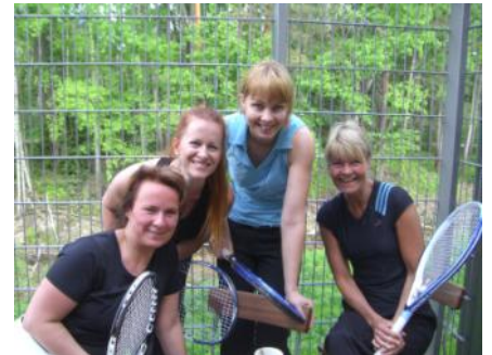
Tenniskärpäsen puremia iloisia ladyja!

Ilmoittautuminen syksyn valmennukseen on alkanut seurun kotisivujen kautta. Kun vieraat jatkopaikkasi ennen juhannusta, on sinulla etuoikeus tunteihin ennen uusia tulokkaita. Voit ilmoittautua mukaan, vaikka junioreiden kohdalla tarkemmat harjoitusten ajankohdat selviävätkin vasta koulujen alettua. Kilpavalmennus alkaa ma 2.8. , aikuisvalmennus ma 16.8. sekä lasten ja nuorten valmennus to 26.8. Hinnat ja valmennusjärjestelmä luettavissa kotisivuilla www.granitennis.fi