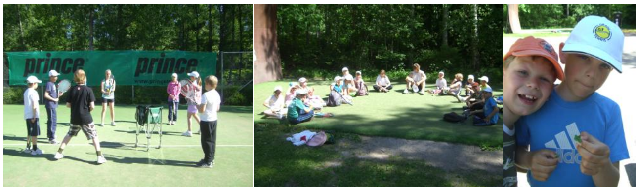
Kuvia kesän 2010 kesäleiriltä (SE)

Kesäkuun leirit saatiin läpivietyä upeissa keleissä ja leppoisassa ilmapiirissä. Tenniksen opettelun lisäksi pelasimme muita pallopelejä (mm. futista, tennispesistä), kävimme uimassa ulkoaltaalla, teimme luontoretken metsään, opimme kasvien nimiä, löysimme neliapiloita ( 15 kpl viikolla 23!!!) sekä pidimme tarinatuokioita mm. terveellisistä elämäntavoista, tenniksen historiasta ja pistelaskusta, tasavertaisuudesta ja sääntöjennoudattamisesta. Elokuussa (vkot 31 ja 32) kesäkurssit ja –leirit jatkuvat, ilmoittaudu mukaan!