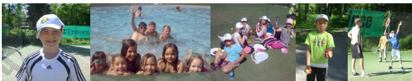
Kuvia kesäleiriläisistä viikolla 23 (SE)

Oikein hyvää ja rentouttavaa kesää kaikille GT:n jäsenille!