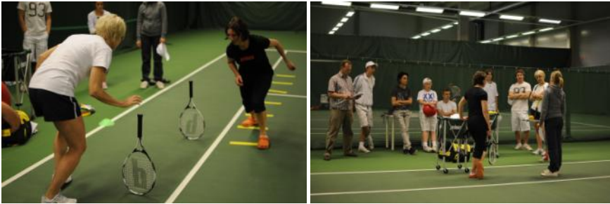
Kuvat kesäohjaajien koulutustilaisuudesta toukokuussa.

Tänä vuonna lasten ja nuorten toiminnallisia tukia haki yhteensä 1 080 hanketta ja tukea myönnettiin 345 hankkeelle yhteensä 617 000 euroa. Eniten hakemuksia tuli lasten harrastusryhmien lisäämiseen ja ohjaajien sekä valmentajien osaamisen kehittämiseen. Grani Tenniselle myönnettiin 1000€ ohjaajien ja valmentajien osaamisen kehittämiseen. Tuen avulla Grani Tennis käynnistää syksyllä 2010 valmentajien ja ohjaajien sisäisen koulutuksen.