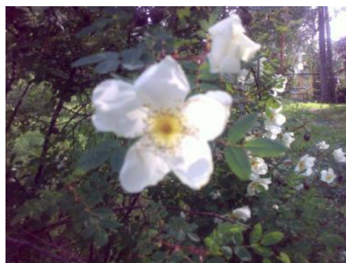
Hyvää juhannusta! Trevlig midsommar!