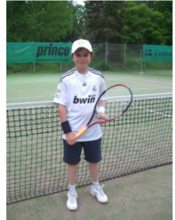
Niklas aloittanut innokkaana kilpailemisen

Lukas Lassooy — Aleks Sokolow 62,63; Lukas Lassooy — Jason Sormunen TCT 76,46,36; Lukas Lassooy — Richard Wohlström ETK 16,06