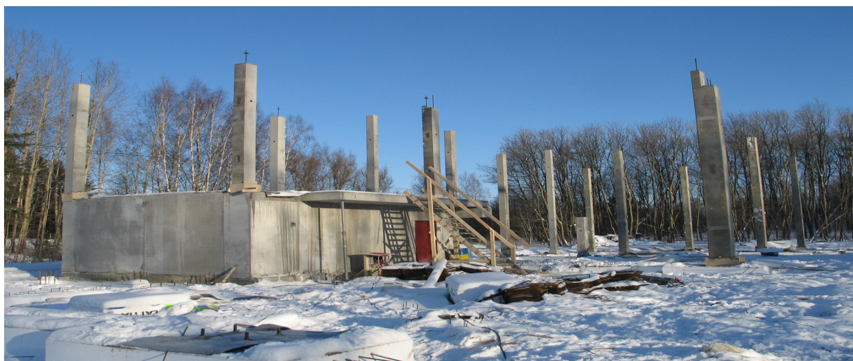
Väestösuoja ja pilarit 31.1.2009

Jos ette vielä ole olleet osoitteessa www.kauniaistenurheilupuisto.fi niin nyt se kannattaa tehdä. Sivut ovat myös nyt ja jatkossakin kaksikieliset.