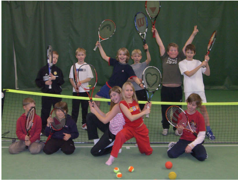
Iloisia GT tennispelaajia

Tule mukaan Kauniaisten palloiluhallissa järjestettävään minitennisturnaukseen, joka on tarkoitettu kaikille alle 12-vuotiaille tytöille ja pojille. Peliä pelataan greipin kokoisella pehmopallolla, matalalla verkolla ja sulkapallokentällä. Kaikille osallistujille vähintään 3 peliä. Pelien pituudet ja sarjat määräytyvät ilmoittautumisten perusteella. Pelit joko klo 9-11.30 tai 10.30-13. Peliajat julkaistaan kotisivuilla pe 20.3. Ilmoittautumiset 19.3. mennessä (kts. kotisivuilta ilmoittautuminen). Paikan päällä on mahdollista harjoitella minitennistä ohjatusti demokentällä. Kutsu ja pelisäänöt tulevat kotisivuille vko 7.