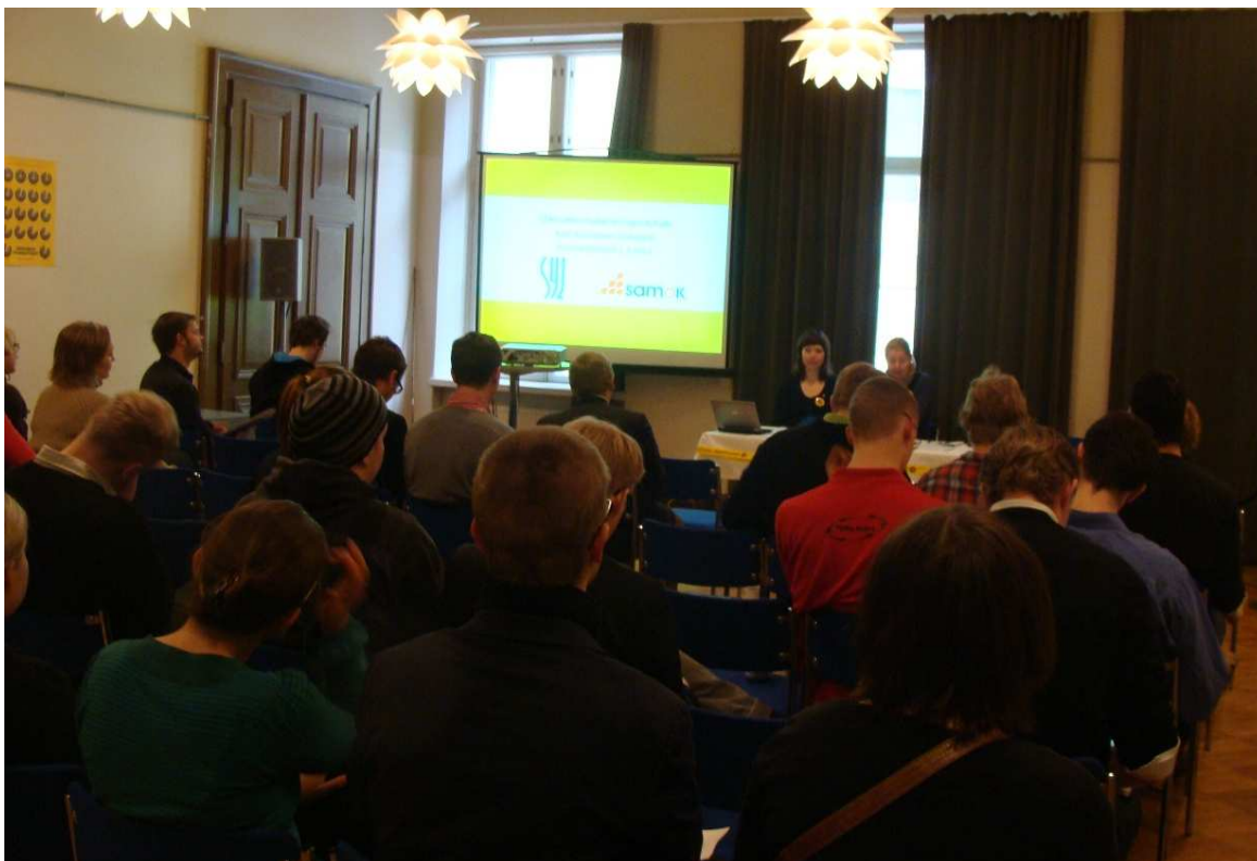
Opiskelijoiden vaalitavoitteiden julkistamistilaisuus ti 1.3. Vanhalla ylioppilastalolla Helsingissä

Maaliskuusta lähtien opintotuki on ainoa vähimmäisetuus, jonka kehitystä ei ole sidottu elinkustannusten nousua seuraavaan indeksiin. Opintotuen sitominen indeksiin on elintärkeä parannus opiskelijan toimeentuloon, kun taas sen näivettäminen ajaa entistä suurempaan taloudelliseen ahdinkoon. Indeksiin sitominen on oikeudenmukainen teko, jolla on myönteisiä vaikutuksia myös opintoaikoihin ja työurien pidentämiseen. Säädyllyinen toimeentulo antaa opiskelijalle paremmat mahdollisuudet valmistua tavoiteajassa.