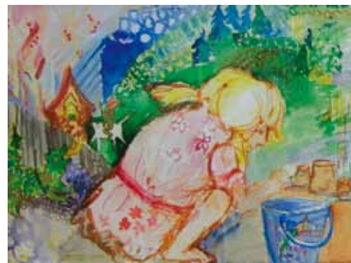
Helga Tollander: Lapsen mielikuvitusmaailma 1.

Maalauspuhjan paksuus tai materiaa- li vaikuttaa työn luonteeseen. 80-luvulla taiteilijat käyttivät paljon paksua kiila- pohjaa, se oli hyvin tavallinen. Paksun veistoksellisen pohjan sopivuutta omaan