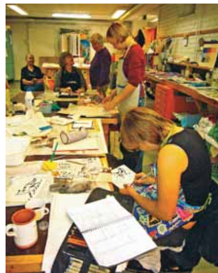
Kartonkigrafiikka 2:n kurssilaiset ahkeroinvat Montussa 18.–19.9.2010.