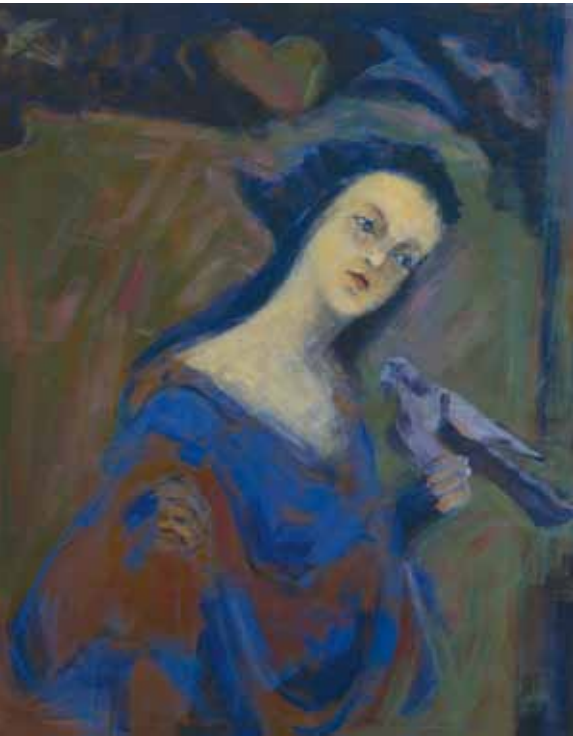
Raili Lappalainen: Madonna.

oma, hyvin vaativa maailmansa. Kubistisyyppisessä kompositiossa on hyvä olla hierarkia; on asia, joka dominoi ja sen ohella toiset, säästävät asiat. Enemmän maalatessa tapahtuukin usein pelkistämistä, asioita yhdistyy, värialueita poistuu ja toisia jää jäljelle niin, ettei kuvan joka puolella ole liikaa tavaraa.