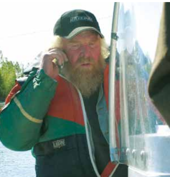
Kipparilla oli mukkea parta ja hyvät jutut.

sitten sipaisi yhdeltä eukolta huivin silmille, niin se päästettiin vapaaksi. Joku oli parkaissut, että: "Piru se on!"