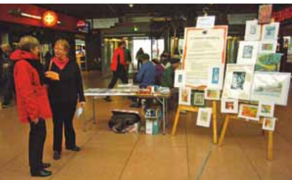
Seura osallistui 16.10.2010 näyttävillä arpajaisilla kauppakeskus Columbuksessa Vuosaari-Seuran järjestämään Kulttuuritoritapahtumaan.

● Maalauskurssi Sasekalla elokuussa 2010.