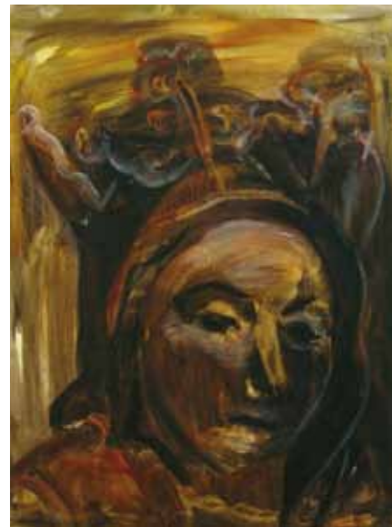
Maila Niskanen-Kopio: Kalvolan madonna.

Maisemamaalauksessa voi rakentaa teoksen myös kylmien pohjasävyyden päälle. Siitä tulee toisenlainen tunnelma. Kylmien sävyyden päällä tulee kuitenkin olla lämpimiä värejä, jotta kuva alkaa sykkiä.