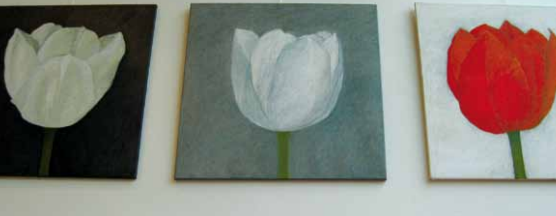
Ulla Vapaavuori: Maalaus II-IV.