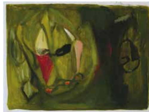
Tua Mylius: Naamiot - Masker.