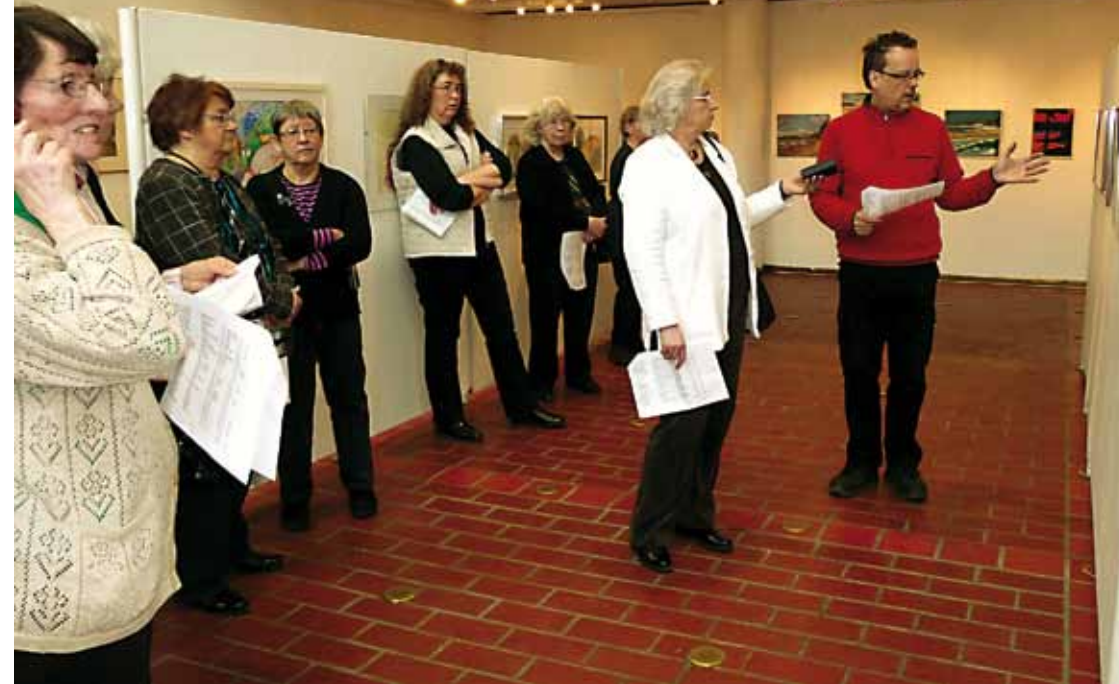
Kritiikki-iltaan kokoonnuttiin kuulemaan juryttäjän mielipiteitä näyttelyn töistä.

aiheena akvarelliin, mutta aurinkoisen päivän mahdollisuudet valojen ja varjojen suhteen ovat paremmat.