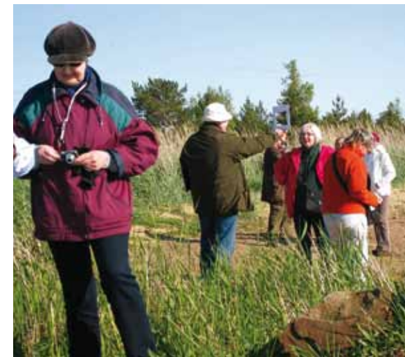
Ensimmäisenä iltana tutustuttiin aiheeseen.

T oisena päivänä matkasimme Lepäsen saareen. Meitä oli kyytimässä paikallinen kalastaja ja hänen poikansa. Kipparilla oli muhkea parta ja hyvät jutut. Erittäinkin jäi mieleen kertomus hirvestä, jota ei paikkakunnalla ennen vanhaan tunnettu. Hirvi otettiin miehisä kiinni ja eräs isäntä suunnitteli siitä itselleen hevosta peltotöihin. Kun hirvi