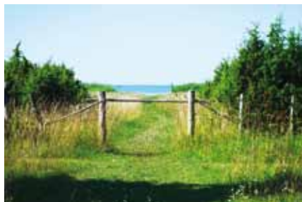
Takapihalta polkua myöten rannalle.

Olen ensi kertaa matkalla Saarenmaan Kuressaareen. Mielikuvissa määränpäässä siintää aurinkoinen ja lempeä olo, paikallishistoriaa, valssi soi, tuuli laulaa ja yltymperiinsä on ihania itse tehtyjä käsitöitä ja taide-esineitä.