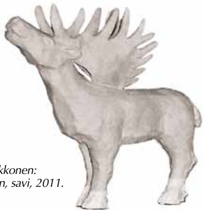
Eeva Liukkonen: Hirvieläin, savi, 2011.