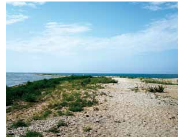
Tältä se maailmanloppu näyttää!