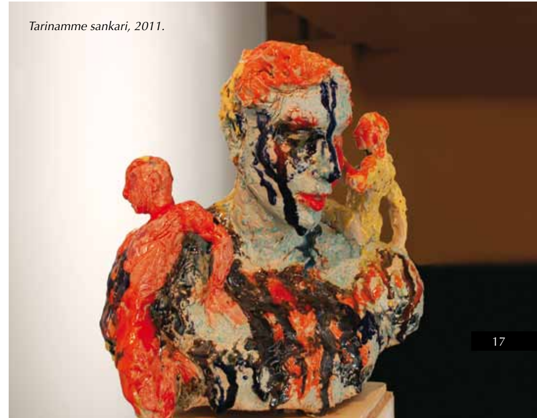
Tarinamme sankari, 2011.

Barokkimiehen kritiikissä sinua sanottiin rajojenylittäjäksi tai rajojenrikkojaksi.