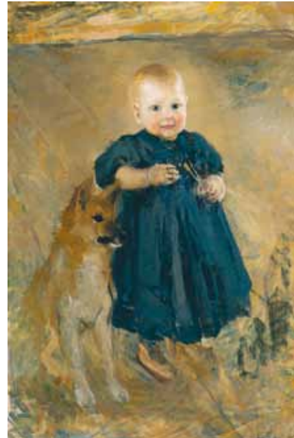
Akseli Gallen-Kallela: Impi Majatta ja Kapperi , 1892. Yksityiskokoelma.

Kevät -freskon kuvitteellinen, harjun päältä avautuva järvimaisema on Rapo-