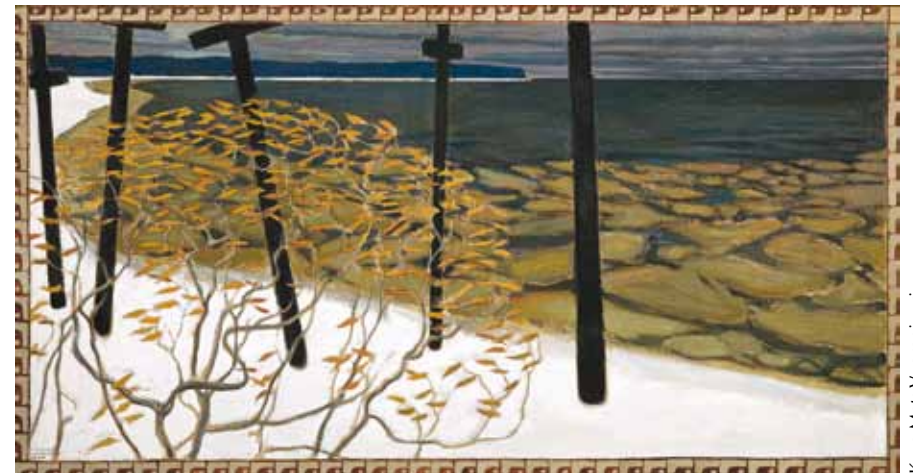
Akseli Gallen-Kallela: Syksy , 1902. Esityö Juseliuksen mausoleumin freskoa varten. Sigrid Juselius Stiftelse.