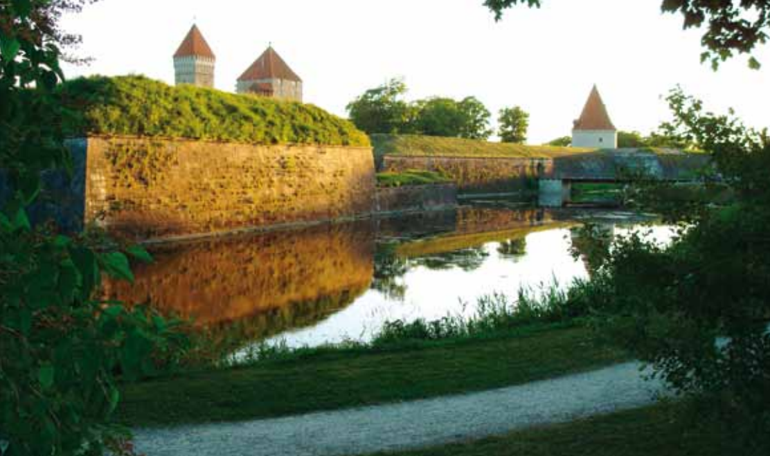
Valon ja varjojen leikkiä Piispanlinnan muureilla.