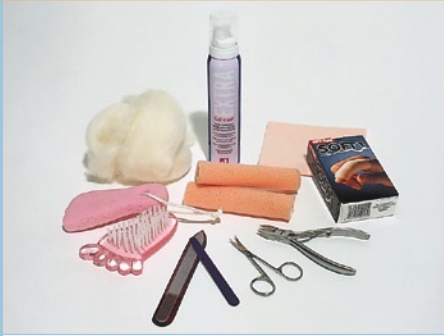
Apteekista ja jalkahoitolasta saatavia omahoitotuotteita.

mistelusalit) suojatossuja. Jos syytä aiheuttaa kipua ota yhteyttä rekisteröityyn jalkojenhoitajaan tai jalkaterapeuttiin.