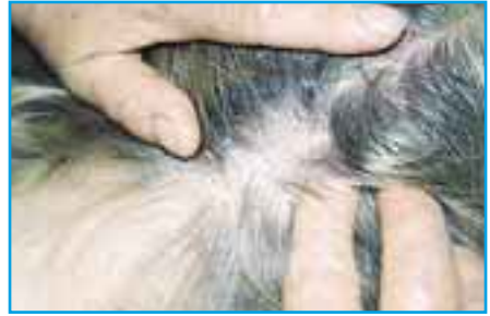
Psoriasisläiskien yksi tyypillinen esiintymispaikka on hiuspohja. Läiskää peittää hilsekerros.

Hilseen kuoriminen kuuluu psoriasiksen hoitoon, jotta paikallishoidot, esim. lääkevoiteet ja valohoito, pääsevät vaikuttamaan paremmin. Suihku ja kylpeminen kuorivat hilsettä jonkin verran, mutta salisyylihappovalmisteet, kuten öljy tai vaseliini, ovat tehokkaampia. Niiden annetaan vaikuttaa iholla esim. yön yli. Hilsettä ei pidä irrottaa raapimalla, sillä läiskien iho rik-