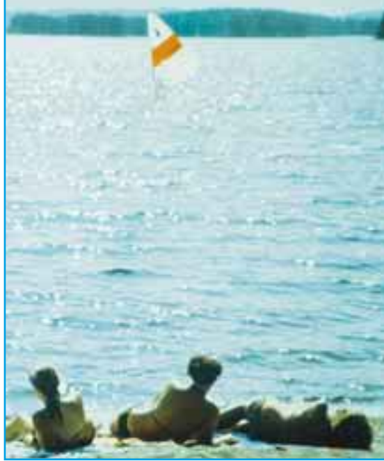
Auringonvalo on luontainen psoriasisin hoitotapa.

Systemiset hoidot ovat sisäisesti käytettäviä hoitoja, jotka vaikuttavat kehon toimintaan eli systeemisesti, esim. immuunijärjestelmän tiettyyn osaan. Niitä