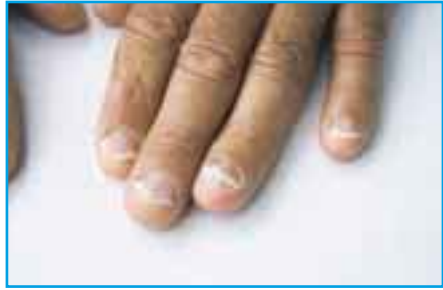
Psoriasiksen kynsioireet muistuttavat sieni-infektion aiheuttamia kynsimuutoksia.

Psoriasiksen diagnosoimiseksi ei ole olemassa laboratoriotestiä, vaan taudinmääritys perustuu lääkärin erityisosaamiseen ja kokemukseen. Ihosta voidaan ottaa koepala diagnoosin varmistamiseksi.