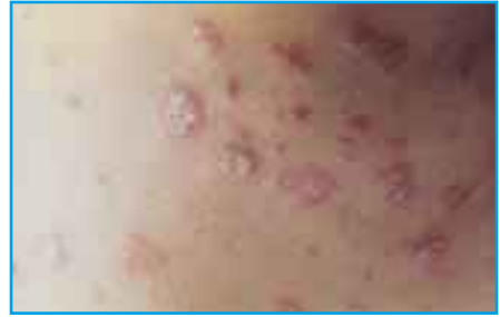
Psoriasis alkaa usein pieniläiskäisenä pisarapsoriasisiksenä.

Läiskäpsoriasis on yleisin psoriasis muoto, jossa iholla esiintyy erikokoisia läiskiä. Niiden ”mielipaikkoja” ovat kynnärpäät, polvet, ristiselkä ja hiuspohja. Läiskien koko voi vaihdella sentin läpimittaisista kämmenen kokoihin