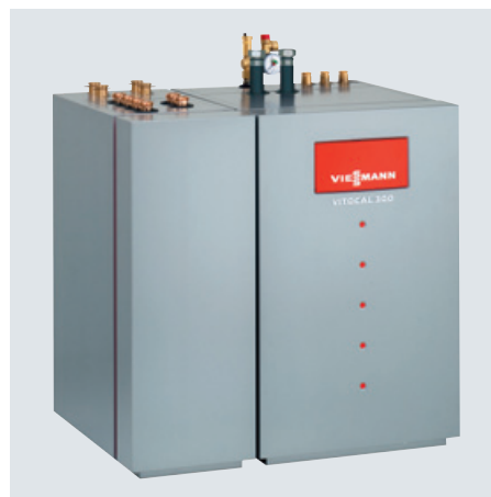
AC-Box ja Vitocal 300-G – tehokas tapa yhdistää viilentäminen ja lämmittäminen

Viessmannin lämpöpumpuille on myönnetty "Gütezeichen Wärmepumpe" -laatu-merkki, joka on tae korkeasta laadusta