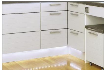
Sokkelivalo toimii hyvänä yövalona

Kontio-Keittiöt -kalusteet kootaan tehtaalla tappiliitoksien avulla, ilman näkyviä kasausruuvien päitä. Kalusteiden rungot ovat maalattua MDF-levyä, kotimaista melamiini- tai laminaattipintaista lastulevyä tai viilulevyä. Kalusteiden ovet, laatikot ja kiinteät mekaniikit ovat rungoissa paikoillaan. Vain vetimien kiinnitys tehtaalla tehtyihin porauksiin tehdään työmaalla, ja kaluste on rungon asennuksen jälkeen käyttövalmis. Siksi myös kalusteiden asennusaika on lyhyt. Kaapit pakataan yksittäin kutistemuovipakkauksiin, joissa ovien suoja on kuplamuovi kuljetus- ja käsittelyvaurioiden estämiseksi. Näillä perusteilla Kontio-Keittiöt -kalusteet erottuvat monien muiden toimittajien tuotteista edukseen. Kontio-Keittiöt -kalusteet elävät ihmisen ja ajan mukana. Kontio-Keittiöt -kalusteet yhdistyvät nykyaikaiseen tekniikkaan ja suomalaiseen keittiöperinteeseen. Korkean laadun takeeksi myönämme kalusteillemme viiden (5) vuoden toimivuustakuun.