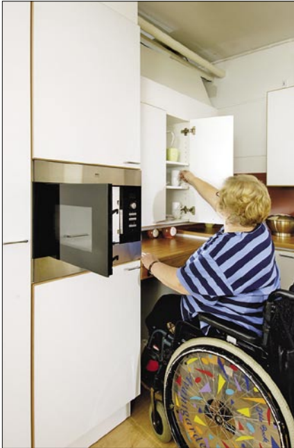
Seinäkaapin korkeussäätö mahdollistaa asioiden oton kaapista pyörätuolista käsin.