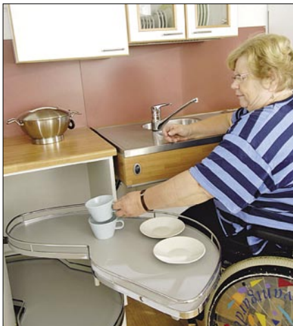
Alakaapin piilokulmamekanismilla saadaan nurkka hyötykäyttöön.