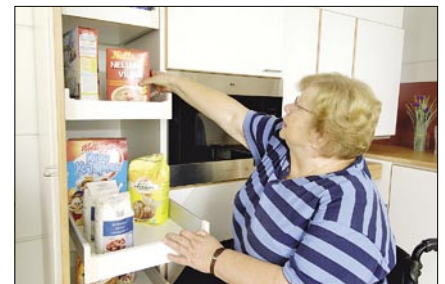
Sisälaatikot helpottavat tavaroiden ottoa komerosta

Kontio-Keittiöt Oy:n erikoiskalusteisiin voi tutustua tehtaan näyttelytilojen lisäksi, Toimivalla Kodilla, Helsingin Käpylässä.