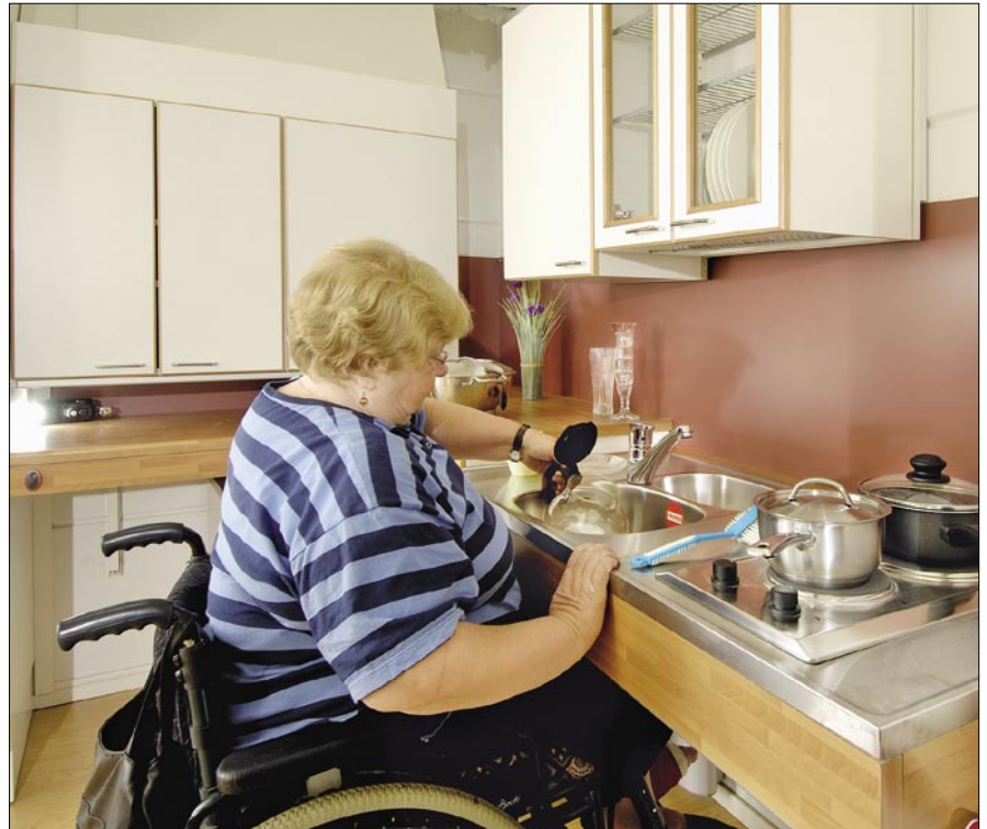
Kontio-Elinkaarikeittiön säädettävä allas- ja keittiötaso edessä, taustalla korkeussäädettävä seinäkaappiryhmä.

Kontio-Keittiöt -valikoimasta löytyvät sekä kaappien että työskentelytasojen korkeussäätöratkaisut joko mekaanisina tai sähkötoimisina. Myös eteiskomerot on suunniteltava siten, että pyörätuolilla liikkuva yltää hyllyille ja tangoille. Liikuntarajoitteisten wc- ja kylpyhuonekalusteissa on tukevat kaiteet, joiden avulla pyörätuolissa oleva ihminen voi ottaa tukea tai liikutella itseään.