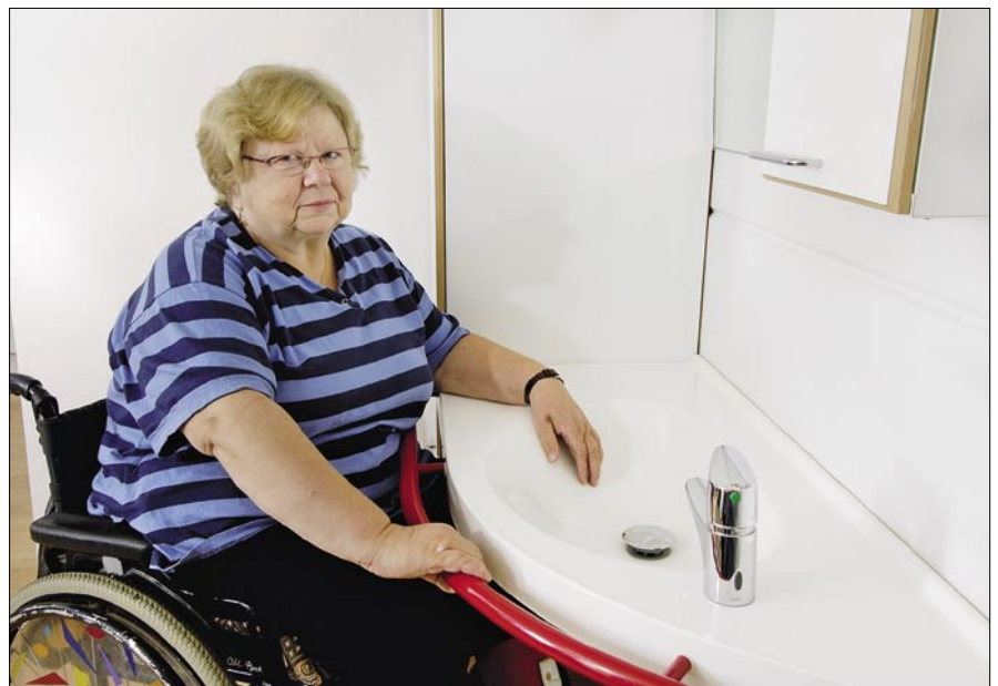
Kontio-WC -kalusteet. Kaiteellinen allastaso.