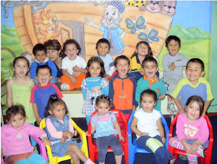
Vuoden 2010 pepekerholaisia.

Koti Katulapselle ry:n Kolumbian-työn tiedotuslehti joulukuu 2010