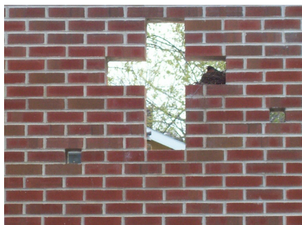
Taivaan muurissa on ristin muotoinen aukko

Uskontunnustuslaulun jälkeen keräämme kolehdin tähän tarkoitukseen. Kiitos avustasi – Taivaan Isä siunatkoon lahjamme!