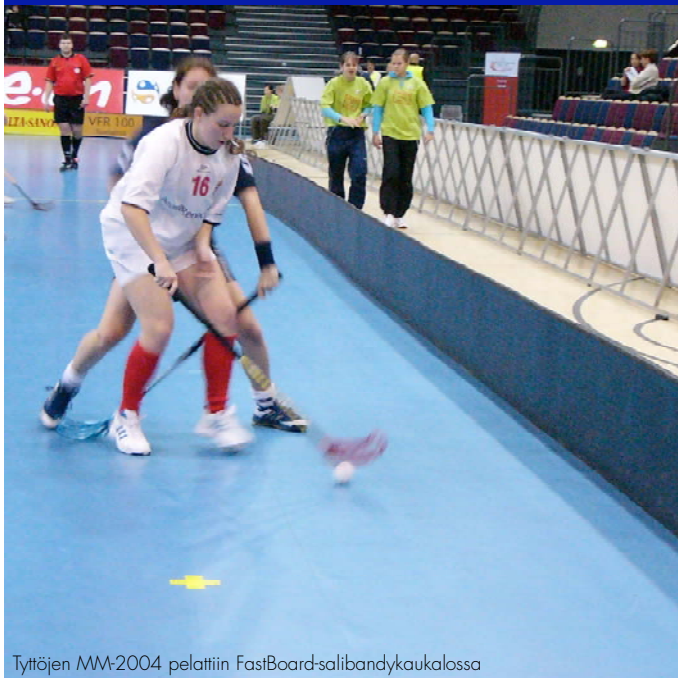
Tyttöjen MM-2004 pelattiin FastBoard-salibandykaukalossa