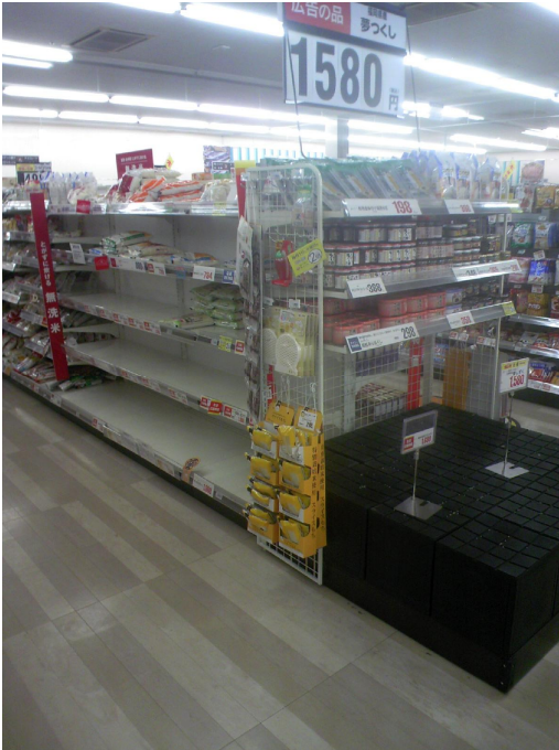
Harvinainen näky rikkaana pidetyssä Japanissa - ei riisiä, vaan tyhjiä hyllyjä!

Sielunhoidollisia keskusteluja on tavallista enemmän. Voidaan varmaan oikeutetusti kysyä, miksi Jumala salli tällaisen onnettomuuden tulla? Vastauksia on vähän, oikeita vastauksia kenties vielä vähemmän. Mutta; Japani on tunnetusti maanjäristysaluetta, maa järisee todella usein ja hyökyaalloksikin kutsuttu tsunami on kenties maailman tunnetuimpia japaninkielisiä sanoja. Maanjäristykset ja tsunamit, vaikka tulevatkin yllättäin eivät kuitenkaan tule yllätyksenä, niin kuin ensilumi Suomessa. Ihmisiä on paljon ja vuoristoisen maan asutus on keskittynyt suureksi osaksi rannikon tasangoille. Vaikka tiedetään, että luonnonkatastrofi voi iskeä milloin vain, on toivottu ettei se osuisi kohdalle. Nyt sellainen on tapahtunut, ja arviolta 28 000 (kaksikymmentäkahdeksan tuhatta!) ihmistä on menettänyt henkensä tai on kateissa. Tämä on saman verran, kuin Riihimäellä (tai Imatralla / Vihdissä) on asukkaita. Tilanne on aivan uskomaton.