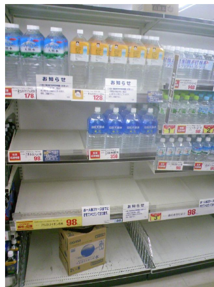
Vesipullot vähenevät hyllyiltä

Koben maanjäristyksen (1995) jälkeen oli Japanissa kampanja, jonka nimi oli GAMBARE KOBE. Suomennettuna jotakuinkin "yritä", "älä luovuta", "jatka sinnikkäästi" Kobe, tällä hetkellä tämä ydinonnettomuuden takia onnettomuus koskee koko maata ja kampanjan nimikin on GAMBARE NIPPON, "Tsemppiä Japani!".