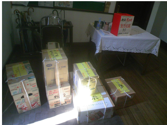
Avustuspaketteja Hakatan kirkon eteisessä 27.3.2011 lähdössä kriisialueelle Sendain kirkon kautta jaettavaksi

Eloonjääneistä huolehtimisen pitäisi olla pääasia, mutta päähuomion vie Fukushima ydinvoimalaitoksen edelleen jatkuva vaaratilanne. Voimalan lähialueelta asukkaita on evakuoitu ja erimielisyyttä on siitä, miten laajalle evakuointi pitäisi levittää. Miten onnettomuus vaikuttaa maan ruokahuoltoon, kun alueen maa- ja meijeritalousalueiden tuotteet joutuvat säteilyn vuoksi myyntikieltoon?