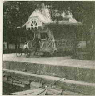
Tätä limonaatikioskia kutsuttiin myös vesikioskin nimellä.