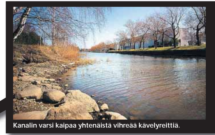
Kanalin varsi kaipaa yhtenäistä vihreää kävelyreittiä.

➤ Tärkeät kulttuurirakennukset saavat keskuspuiston ympärilleen.