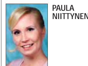
PAULA NIITTYNEN Kirjoittaja on Länsi-Suomen toimittajajärjittelijä.

Raumalla edellytykset kaupunkipuistolle paranevat, mikäli tarkastelualueita laajennetaan koskemaan myös Pohjankadulta alkavaa kulttuurihistoriallista aluetta. Raumanjoen tässä osassa sijaitsevat muun muassa Kirstin talo, lukuisat muut Vanhan Rauman arvokkaat puutalot ja saneerattu vilkkehräämö sekä Rauman Pyhän Ristin kirkko.