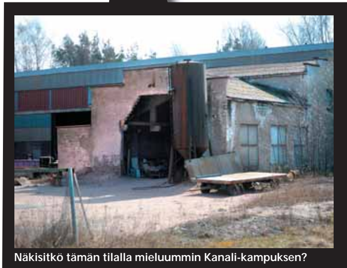
Näkisitkö tämän tilalla mieluummin Kanali-kampuksen?