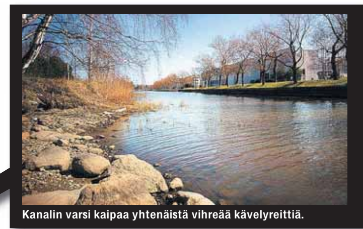
Kanalin varsi kaipaa yhtenäistä vihreää kävelyreittiä.

➤ Tärkeät kulttuurirakennukset saavat keskuspuiston ympärilleen.