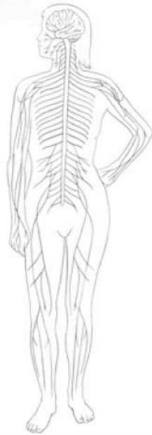
Illustration: Kristin Wienandt

Regulates body's internal functions (e.g., respiration, heart rate, digestion) and general level of arousal