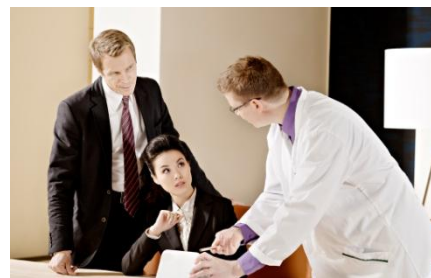
Kasvu- ja kansain- välistymisrahoitus