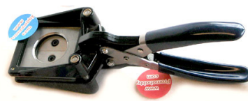
Pihtileikkuri 25mm ja 37x37mm