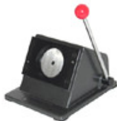
Grafiikkaleikkurit, kaikki koot ja mallit