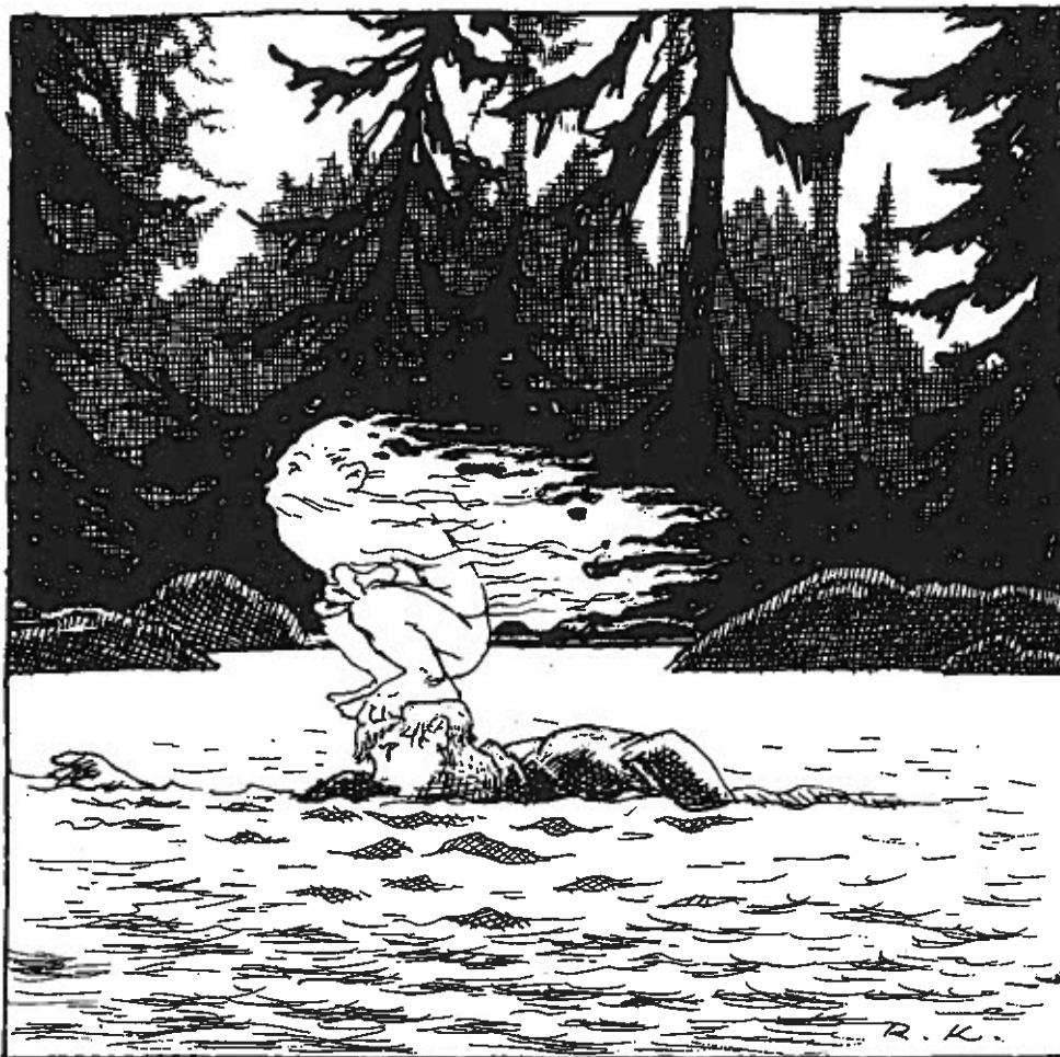
Ukko istahti pojan päälle, ja poika ui rantaan.

– Minä niin pelkään vettä, jatkoi ukko. – En kestä ollenkaan koko ainetta, vaan hajoan olemattomiin, jos siihen joudun.