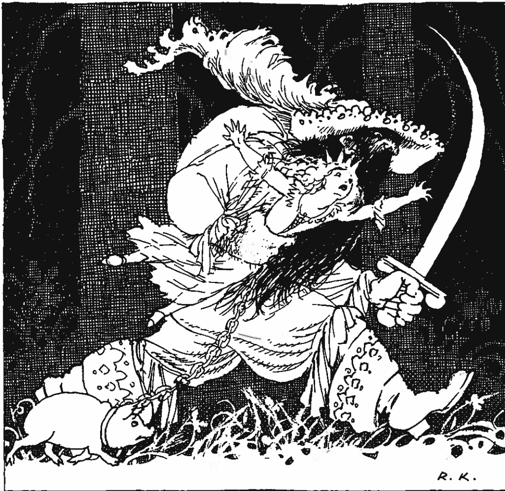
Ruma musta mies raahaa pientä, kirkuvaa, kruunupäistä tyttöä.

— Kukahan siellä lie hätään joutunut? tuumi Pilvenukko. — Tuon vinkumisen kyllä tunnen, sanoi poika. — Sehän on Nassuposuni suloinen ääni. Possuparkani lienee pinteessä. Juostaan auttamaan. He läksivät painaltamaan ääntä kohti ja kohta saivatkin näkyviinsä kumman kulkueen. Ruma, musta mies, paljastettu miekka kädessä raahasi pientä kirkuvaa kruunupäistä tyttöä, ja porsas kipitti vinkuen perässä. Porsas oli