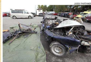
JUSSI PARTANEN Farmarimallinen henkilöauto romuttu tyysin kuolonkolarissa Porissa.

HS.fi Porin kuolonkolarin kusiksi epäillään alaikäistä rattijuoppoa 13.9.2009 7:12 | Päivitetty: 13.9.2009 14:07 STT-HS A A