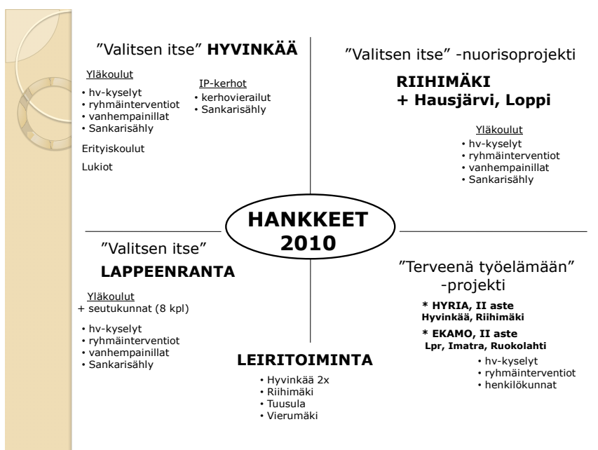
Kuva 2. Hankekartta vuonna 2010

Hankkeita rahoitettiin siten, että niissä käytettiin kauttamme RAY rahaa, Opetushallituksen avustusta, mahdollista muuta rahoitusta esim. Rotaryklubien kautta ja kuntien omavastuu osuutta. Jokainen hanke on järjestöllemme oma projekti perustymme sisällä.