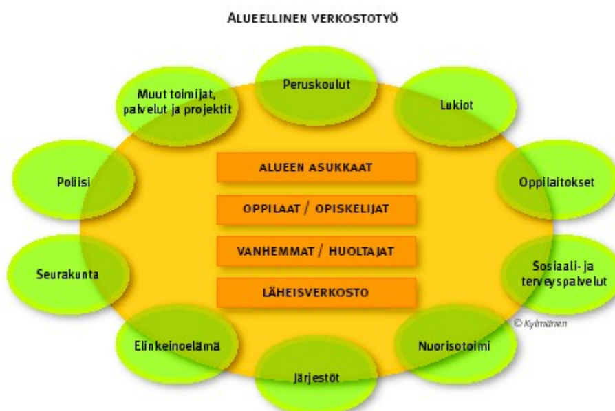
kuva 1; Valitsen itse-hankkeen verkostoa

Lappeenrannan kaupunki ja Elämäni Sankari ry allekirjoittivat 15.2.2006 kumppanuussopimuksen alkoholiohjelman ( www.alkoholiohjelm.fi ) toteuttamisesta Lappeenrannan alueella. Sopimuksessa Elämäni Sankari ry sitoutui toteuttamaan kohdennettua ehkäisevää päihdetyötä Lappeenrannan yläasteiden oppilaille, heidän vanhemmilleen ja yhteistyöverkostolle.