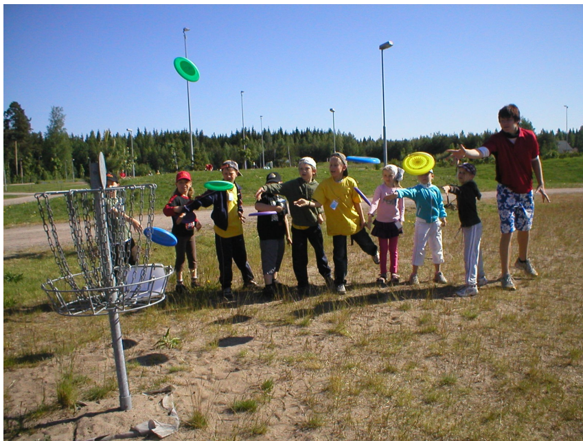
Kuvassa leiriläisiä frisbeegolfin lajipisteellä.