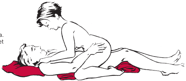
Asento 2. Selkäoireinen mies on selinmakuulla, tyynejä ovat pään, alaselän ja polvien alla. Nainen on hajareisin miehen päällä polvet koukussa.