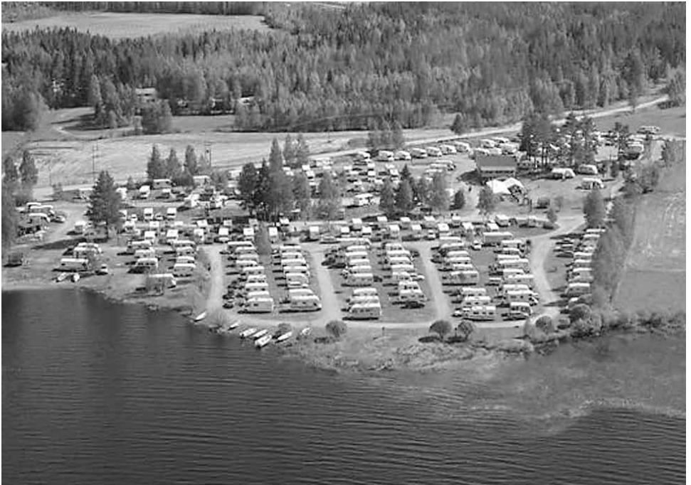
Kuvassa Hiilimutka lettukesteillä