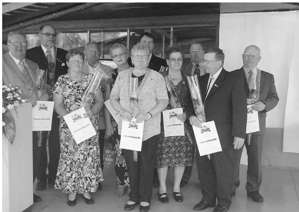
Onnea ansiomerkkien saajille