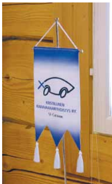
Yhdistyksen hieno standaari.