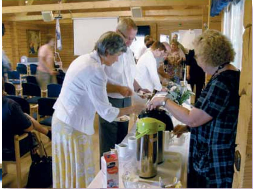
Juhlan päätteeksi maistuiivat makoisat kakukahvit.