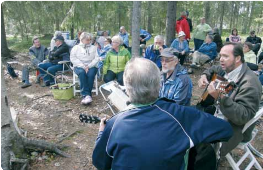
Kiponniemessä pidettiin yhdistyksen vuosikokous ja nautittiin ulkoilmasata, musiikista ja jopa lettusista.