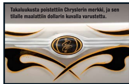
Takaluukusta poistettiin Chryslerin merkki, ja sen tilalle maalattiin dollarin kuvalla varustettu.