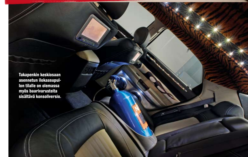
Takapenkin keskiosaan asennetun ilokaasupullon tilalle on olemassa myös baarivarusteita sisältävä konsoliversio.