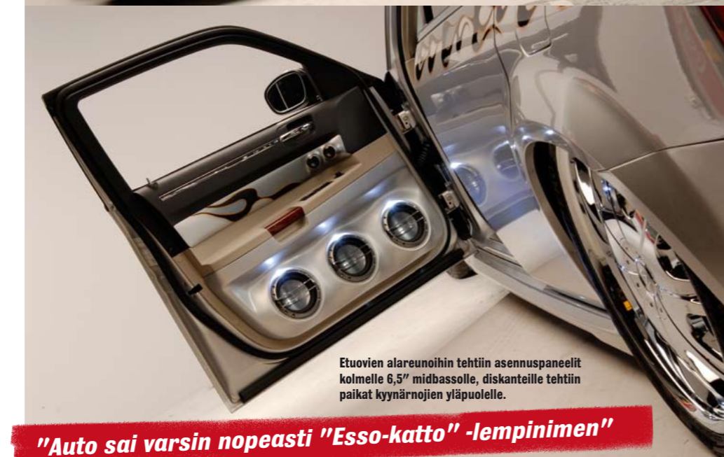
Etuovien alareunoihin tehtiin asennuspaneelit kolmelle 6,5” midbassolle, diskanteille tehtiin paikat kyynärnojen yläpuolelle.