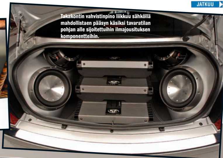
Takakontin vahvistinpino liikkuu sähköllä mahdollistaen pääsyn käsiin tavaratilan pohjan alle sijoitettuihin ilmajousituksen komponentteihin.