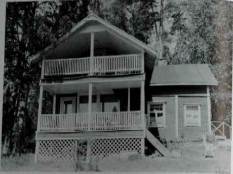
Tiirantie 16. vuonna 2000.