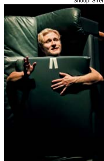
Mies hautaa itsensä, kun oikein lujille ottaa.