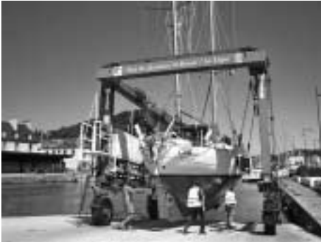
Canace telakoitumassa Le Leguen satamassa.

joka meille aukaistaan. Olemme perillä Port de Leguessa ja kohta satamakapteeni Jerome toivottaa meidät ranskaksi tervetulleeksi ja antaa ensikäden tiedot ja opasteet paikasta. Bretagnessa sijaitseva Le Leguen-satama on erinomainen ja edelleen kehittyvä tarjoten kohtuuhintaisia palveluja joka lähtöön ainakin veneilijöille. Olen ristinyt paikan ”kanjoniksi” sillä satama sijaitsee laakson pohjukassa ja täysin suojassa lähes kaikilta tuuilta. Sulun takana oleva satama tarjoaa mahdollisuuden jättää vene myös jokisuis-