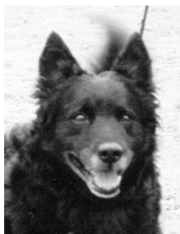
Ensimmäinen agilityskilpailut mudi FIN MVA EUJV-91 Szófogadás Tizen-ötös "Ötö".