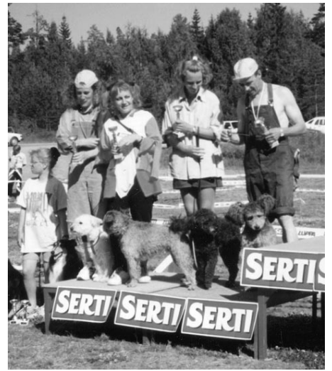
Maksipumien Agirotujoukkue vuodelta 1994 "Gremlins IV".