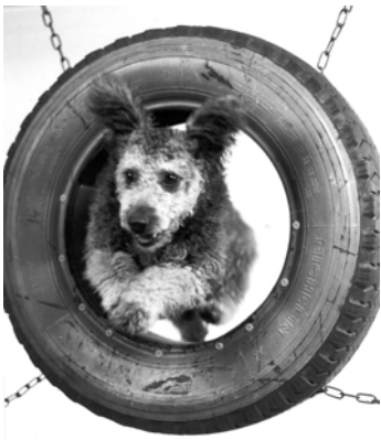
Pumiuros Kilvan Zsarnok "Jami" on mm. SM-hopeamitalisti vuodelta 1990