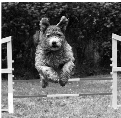
FIN AVA Touhutuvan Tuhattaru "Tiko"