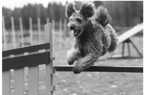
Monipuolinen taituri KANS AVA & MVA FIN TVA Napos Joska "Joska"