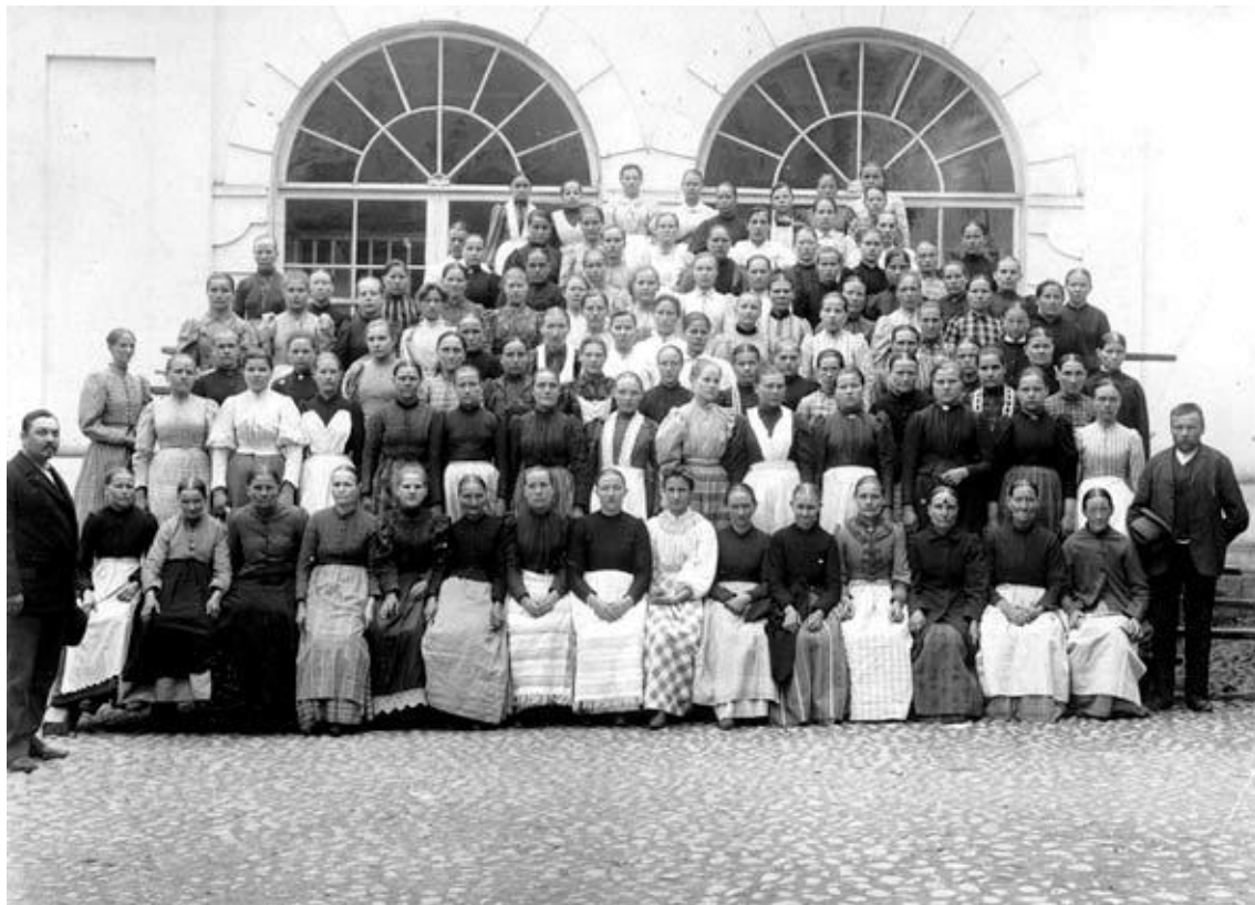
Tampereen Finlaysonin puuvillatehtaan työntekijöitä v.1890-luvulla.