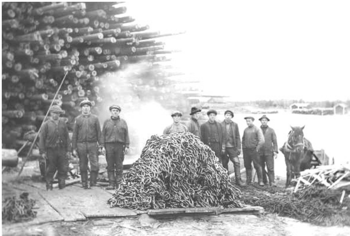
Rautaketinkien pikeys käynnissä Lestijokisuulla, Himangalla