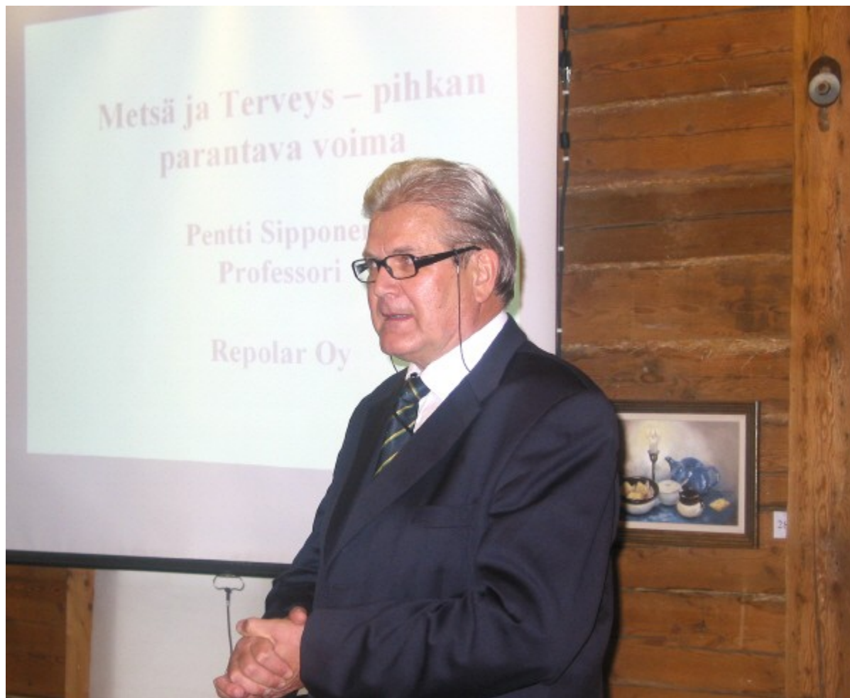
Alnus ry:n luentosarjan ensimmäinen luento Tapion Tuvalla.