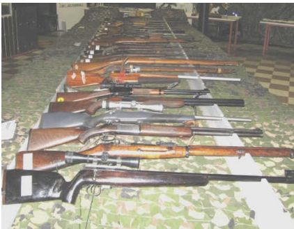
Paljon mielenkiintoisia aseita eri vuosisadoilta.

Perustettu 1962, pinta-ala 13300 ha, jäseniä 360 Perustettu 1958, pinta-ala 3500 ha, jäseniä 100 Perustettu 1964, pinta-ala 5500 ha, jäseniä 130