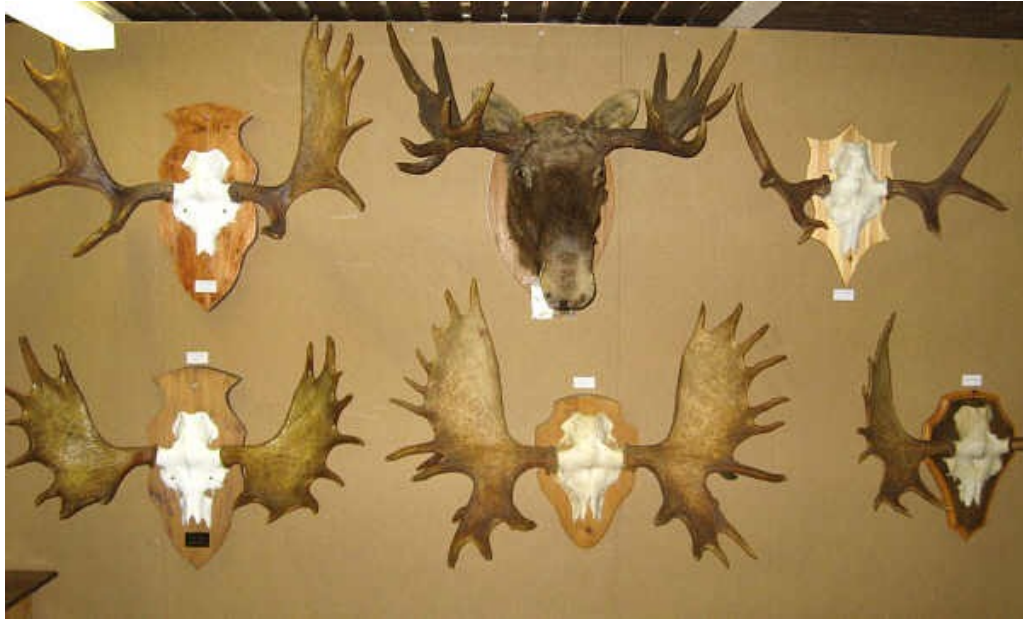
Esillä oli myös seinällinen himankalaisten upeita sarvitroifeita, tässä muutamia.