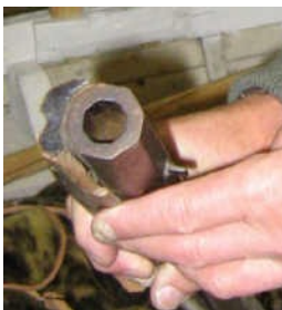
Hyljekivääri 1800-luvun alusta