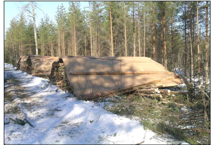
Kuva 1. Välivarastokasat Kruunupyyn kohteella

Kuvasta 2 nähdään, että aisaus ei ole edistänyt puun kuivumista välivarastossa. On oletettavaa, että kassan tiiviys ja kattaminen ovat poistaneet aisauksen vaikutuksen. Lisäksi alle 10 % aisautumisaste ei ole riittävä edistämään luonnonkuivumista, eikä myöskään oleellisesti paranna aisatun puun laatua esimerkiksi pellettien raaka-aineena.