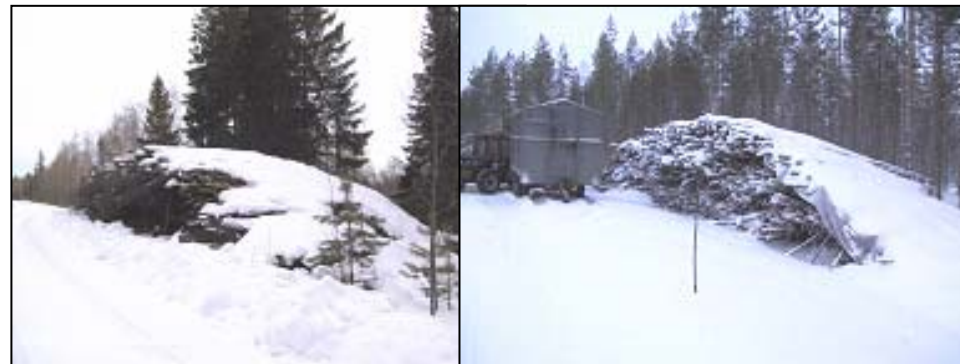
Kuva 3. Peittämätön kasa kosteus 45 %.

Peitettyjen kasojen kosteudet olivat keskimäärin 10 %-yksikköä alhaisemmat kuin peittämättömien.