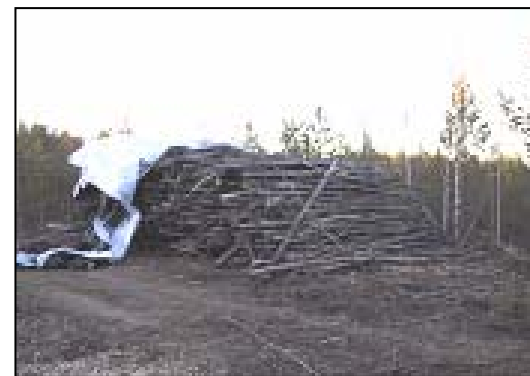
Kuva 5. Huono kasojen hoito johtaa nouseviin työ- kustannuksiin ja aiheuttaa energiasisällön alenemista.