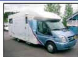
TEC FREE TEC 708 TI 2009 0 46700.00