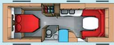
Cabby 740 + FM