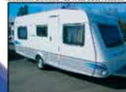
TEC 500 TOP TRAVEL KING 2009 0 25620.00