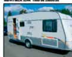
TEC 520 GK TOUR LIVE 2009 0 23000.00