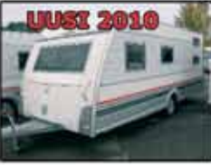
CABBY 628 F2C 2010 0 32800.00