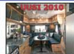
CABBY 620 + F3 BLACK LINE 37.900 €