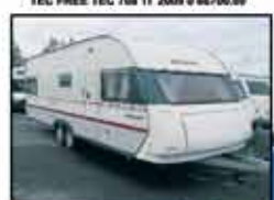
SOLFER 610 FINLANDIA 1997 0 19900.00