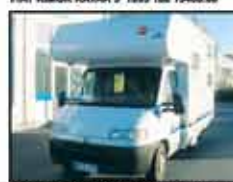
FIAT BURDNER 535 ACTIV-00 1040km 22.800€