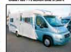
TEC ROTEC 662 TI 2009 0 88800.00