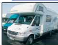
MB-HYMER 5344 1995 64 29800.00