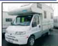
FIAT RIMOR KAYAK 5 1995 188 15400.00