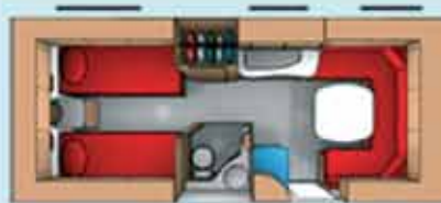
Cabby 620 + L