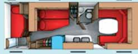
Cabby 740 + F2C