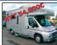
KARIMANN ONTARIO A 670 YB UUSI 64 900€