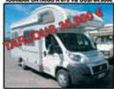
KOALIS A 640 Fiat 130 Multijet-07 200km 43.000€