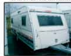
CABBY 620+ L 2009 0 29750.00

Finn Caravan Oy Juvankartanontie 20, 02920 Espoo Puh. 09-854 1033, fax. 09-854 1044 finncaravan@finncaravan.fi