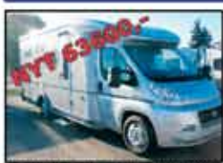
KARIMANN ONTARIO 725 TI EIB UUSI 73600.00